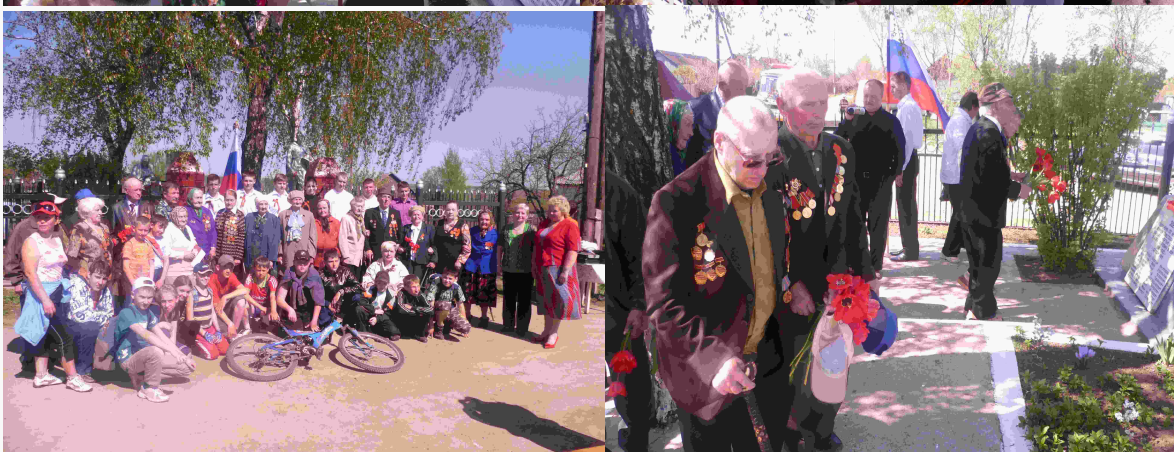
На Братской могиле в д. Георгиевское